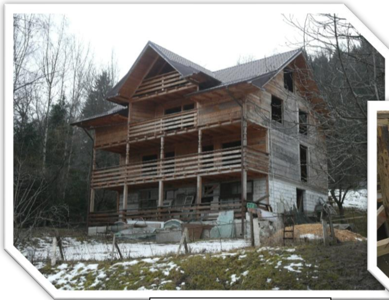
Fig.1 Centru de resurse

Alegând să sprijiniți Centrul Aquaterra, nu doar că investiți în educația de calitate și în protecția mediului, dar vă asigurați un loc în avangarda schimbării pozitive. Să lucrăm împreună pentru un viitor în care educația și respectul pentru natură să formeze coloana vertebrală a societății noastre.