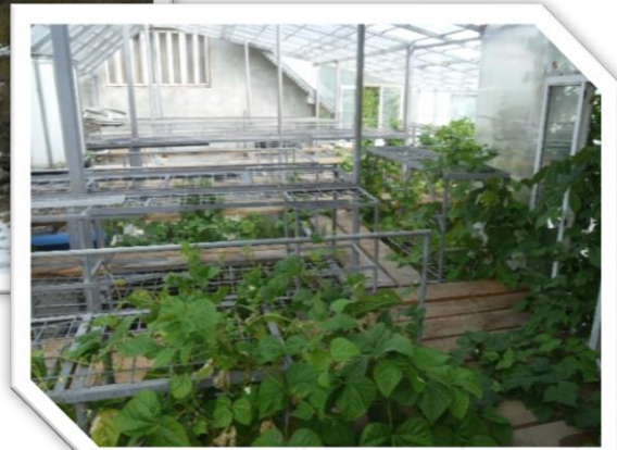
Fig.4 Modul experimental de vizitare de acvacultură/acvaponie/permacultură