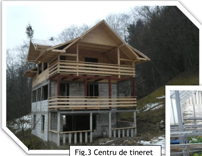
Fig.3 Centru de tineret