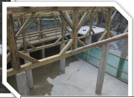
Fig.2 Stație de acvacultură